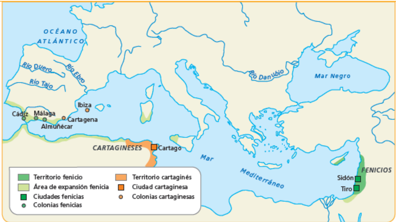
1 Mapa de los territorios conquistados por los fenicios y los cartagineses.

Además de los griegos, por el mar Mediterráneo también llegaron a la Península otros pueblos colonizadores, como los fenicios y los cartagineses.