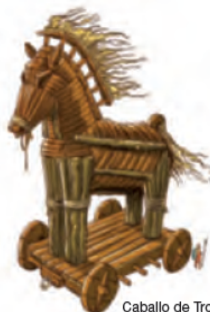
Caballo de Troya.