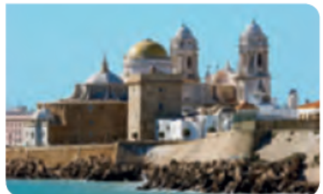
2 La ciudad de Cádiz, fundada por los fenicios, es una de las ciudades más antiguas de Europa.