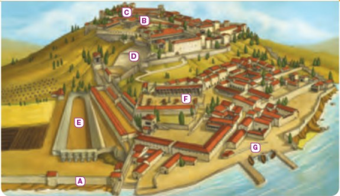
2 Colonia griega. A. Muralla. B. Acrópolis. C. Templo. D. Teatro. E. Estadio. F. Ágora. G. Puerto.