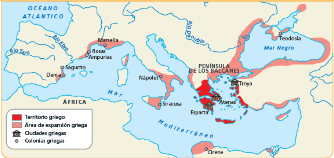
1 Mapa del territorio y las colonias griegas en la Antigüedad.

Hace unos 3.000 años, nació la civilización griega en la península de los Balcanes, al este del mar Mediterráneo. 1