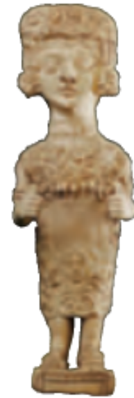
3 Dama de Ibiza. Escultura cartaginesa que muestra a la diosa Tanit.

Los fenicios y los cartagineses fueron pueblos de la Edad Antigua que fundaron colonias en la península ibérica. Los fenicios nos legaron el alfabeto. Los cartagineses se instalaron en las antiguas colonias fenicias.