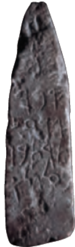
Estela con texto en lengua fenicia.

Los cartagineses fundaron colonias como [ ].